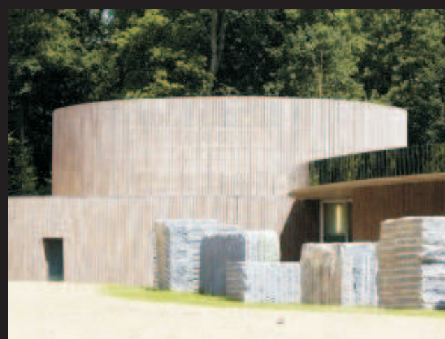
Rennes Metropole Crematorium by Plan