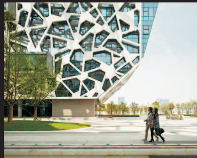
Alibaba Headquarters by HASSELL (China)