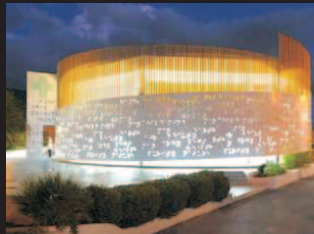
Placebo Pharmacy by Greek studio KL