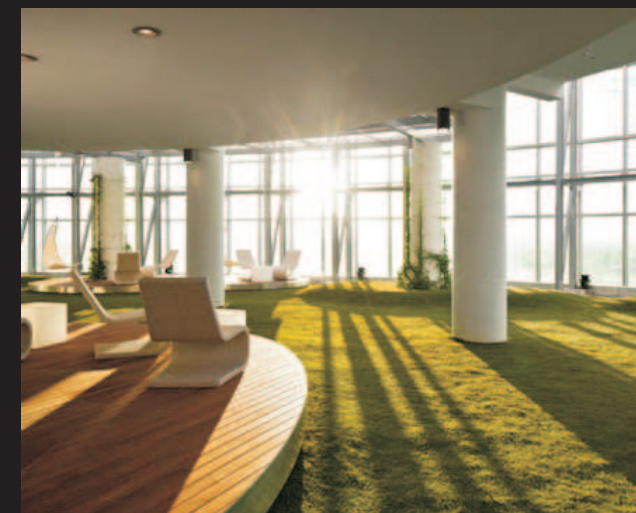
PTTEP Headquarters by HASSELL (Thailand)